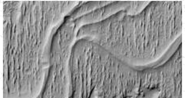
Ríos de Marte hace millones de años.

El análisis reveló depósitos de agua a profundidades de entre 10 y 20 km dentro de la corteza marciana.