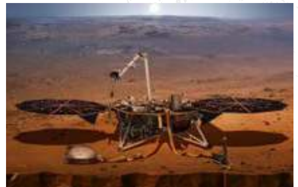
Mars insight Lander.